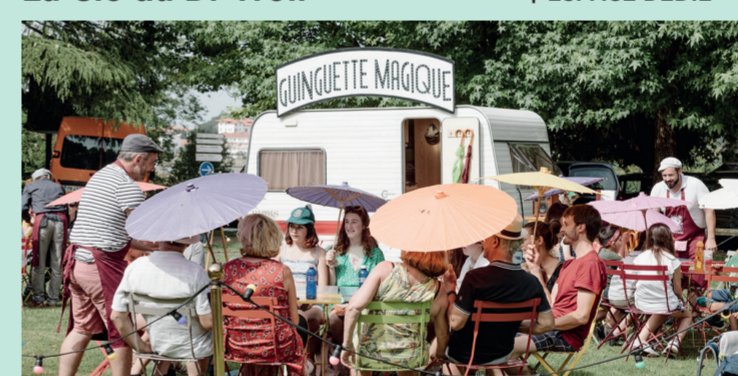
@La Cie du Dr Troll

Un «repas» en terrasse qui prend la forme d'un spectacle de magie dans une ambiance chaleureuse et intimiste comme au restaurant... Sauf qu'ici ce sont les éléments de magie qui composent le menu.