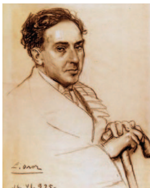
DESSIN DE LEANDRO OROZ

Antonio Machado (Sevilla, 1875 - Collioure, 1939) poeta, dramaturgo y narrador del siglo XX. Su obra, con influencias del modernismo y del simbolismo en sus inicios, evoluciona y representa una expresión lírica de la Generación del 98. Elrick Fabre-Maigné y La compagnie du rêveur nos permiten visitar la belleza y profundidad de la obra del poeta.