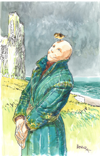
Le personnage Face de Lune créé par Jodorowsky et dessiné par F. Boucq.

François Boucq est né en 1955 à Lille et y vit toujours. Auteur de bandes dessinées, il est l'un des plus grands dessinateurs français.