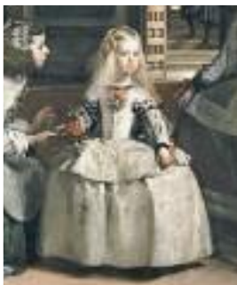
Diego Velázquez, Las Meninas , 1656

Un cours où politique, vie quotidienne, arts et littérature s'entremêlent, car tout produit qui se dit 'culturel' est bien le résultat d'une époque et de son passé, et va influencer aussi la culture d'après.